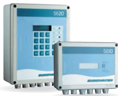
Panouri de comanda SE10 și SE20.

Controlul calendaristic este adesea utilizat în cazul consumurilor regulate de apă. Permite regenerarea la zile și ore prestabilite când nu este producție, de ex. noaptea.